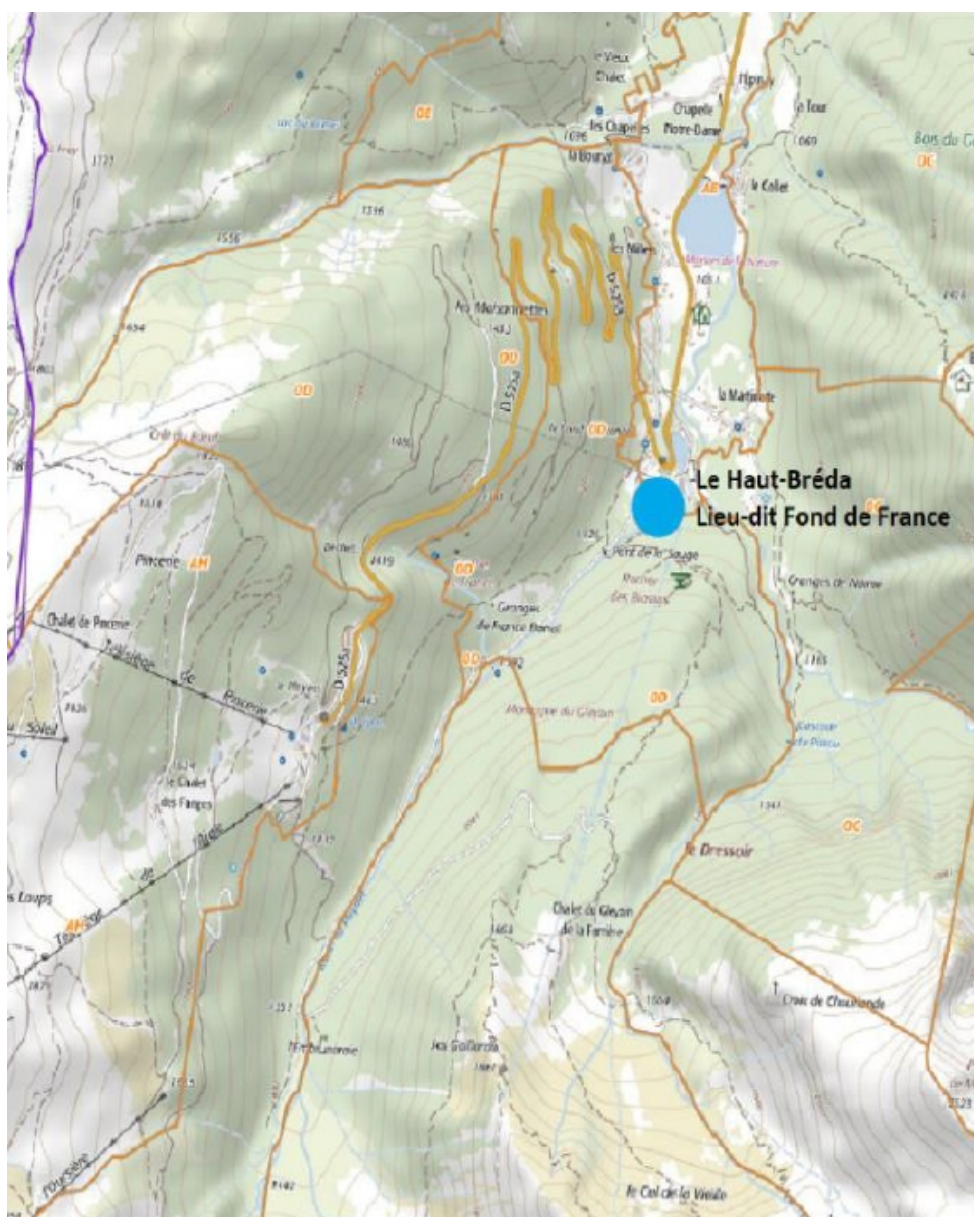
Figure 1: Localisation du projet.

La société Force hydroélectrique de l'Embruneraie (FHYE) porte un projet de création d'une micro-centrale hydroélectrique sur le torrent du Pleynet sur la commune du Haut-Bréda, dans le massif des Sept Laux 2 , en Isère, à une altitude d'environ 1 100 m. L'autorisation est sollicitée pour une durée de 40 ans.